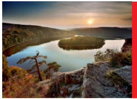
Přehrada Seč na Chrudimsku

Region nabízí hustou a kvalitně značenou síť turistických tras. Ty jsou napojeny na naučné stezky seznamující návštěvníky s nejzajímavějšími místy Pardubického kraje. Krásy kraje si můžete vychutnat také z vyšších míst prostřednictvím rozhleden a městských věží. Pěkný výhled na oblast Toulouvcových maštalí, Železných hor, Orlických hor a za dobrého počasí i Krkonoš se Vám nabízí z Toulouvcovy rozhledny na Jarošovském kopci, ale rozhleden je v kraji samozřejmě mnohem více. Vystoupíte-li na ně, získáte tak pohled na překrásnou a členitou krajinu od rovin až po hornatiny nebo na historická jádra měst. Můžete také nasednout na kolo a šlápnout do pedálů. Jsme totiž vyhledá-