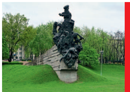
Památník obětem masakru v místech, kde bývala rokle Babí Jar

veršem „Nad Babím jarem pomník nevidět...“ a kyjevskou tragédií kontextuálně přidává k dějinám evropskému antisemitismu a jeho nejzřetelnějším projevům (Dreyffusova aféra, osud Anny Frankové, pogrom v Bělostoku). Báseň vzbudila bouři nevole na nejvyšších místech, stejně jako vyvolala nadšení v občanské společnosti.