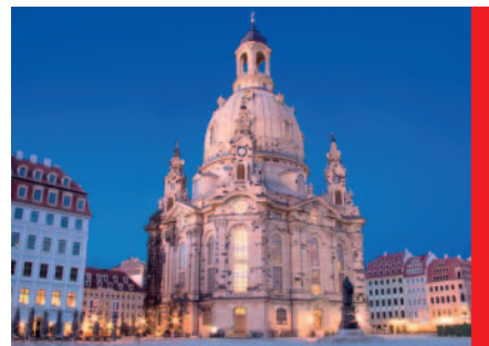
Drážďanský Frauenkirche, Zelenkovo dlouholeté působiště