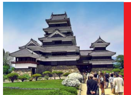
Hrad Matsumoto Jyo