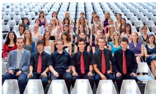
Početná skupina uvaděčů a uvaděček.