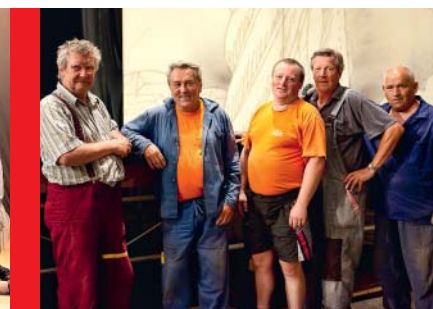
Stavební četa má každoročně na starosti přípravu jeviště a hlediště.

Co vám na letošním ročníku udělalo radost?